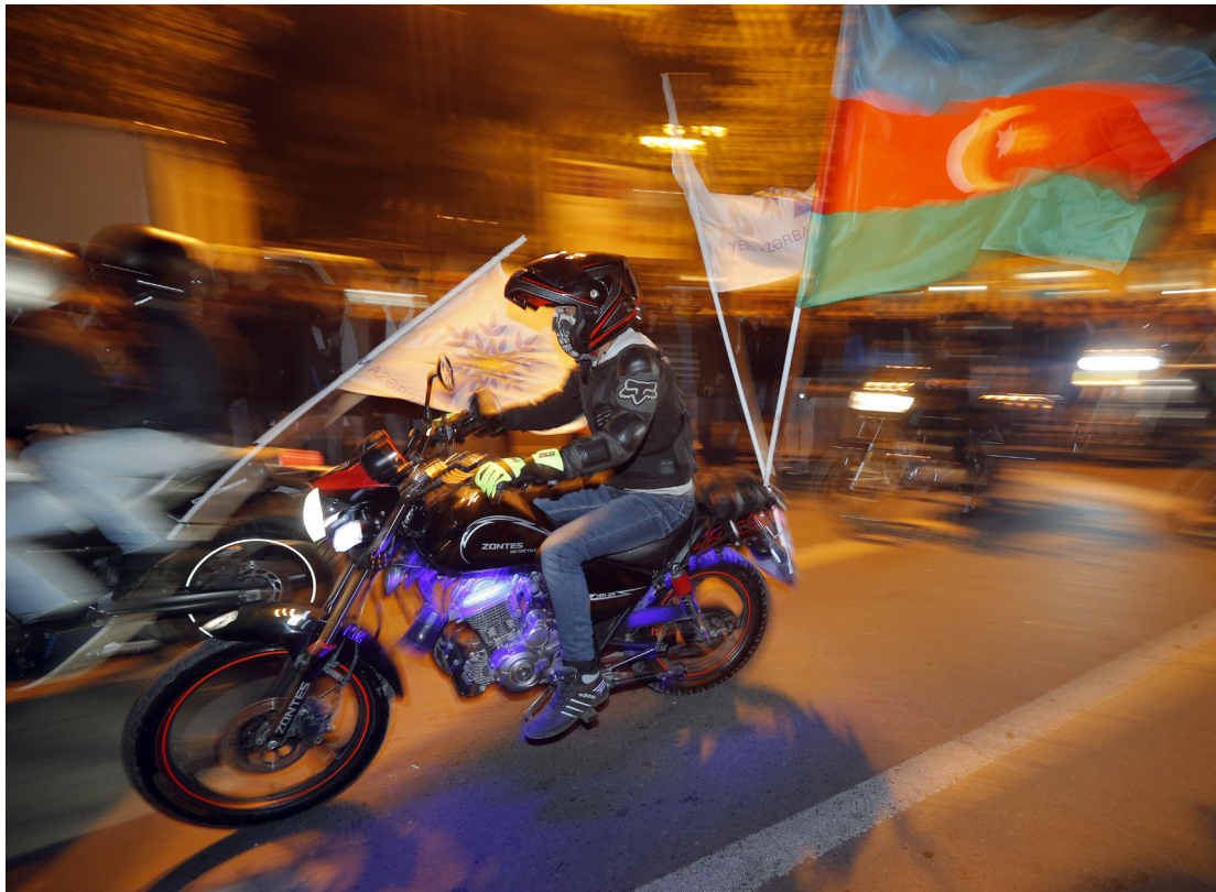
Sett fra innbyggernes side er det nok fremdeles mange som er villige til å gi avkall på personlige friheter i bytte mot relativ stabilitet, skriver artikkelforfatteren. Bildet viser innbyggere i Aserbajdsjans hovedstad Baku som feirer gjenvalget av president Ilham Aliyev i oktober.

M en nå er noe i ferd med å skje som kanskje vil bringe denne isolasjonen til ende. Hele området fra det sørlige Kaukasus til Kinas vestlige grense er på grunn av sin strategiske plassering en slagmark for politisk dominans og innflytelse mellom Russland og Vesten, både USA og Europa. Den nylige ukrainske avgjørelsen om ikke å signere en handels- og samarbeidsavtale med EU, er kun ett