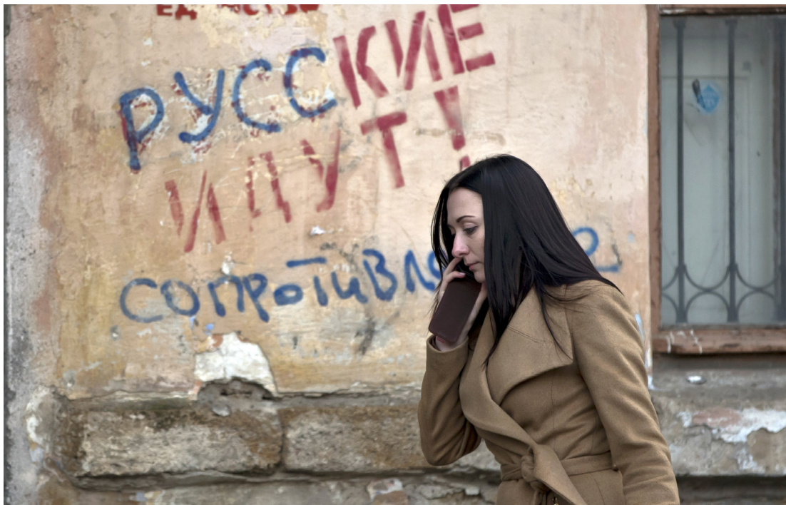
Artikkelforfatteren mener at jo sterkere og overstrømmende nyhetsflommen fra, for eksempel Ukraina blir, jo mindre vil vi etter hvert make å føle medfølelse med de menneskene krisen angår. Bildet viser graffiti på en vegg i Simferopol, Ukraina - oversatt til: «Russerne kommer – gjør motstand»

Uten tvil er det mange velmente tanker bak dem som serverer oss slike nyheter i stadig økende