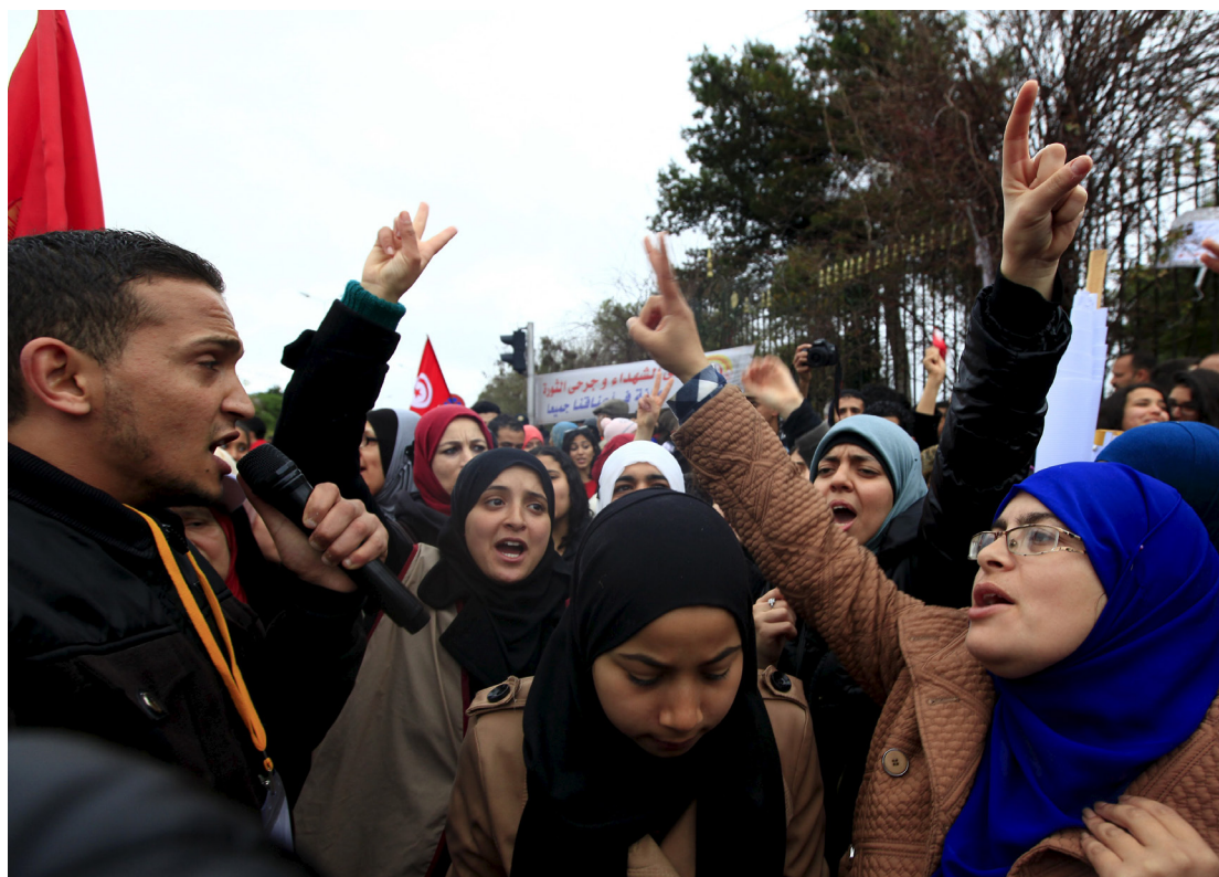
21 mennesker ble drept i terroraksjonen mot Bardo-museet i Tunis 18. mars. Bildet viser en demonstrasjon mot terroren i forbindelse med gjenåpningen av museet.

Det er heller ikke hvilken som helst utstilling det er snakk om. Bardo er hjem til verdens mest betydningsfulle samling antikke mosaikker. Det er ikke et museum hvor du går i endeløse ganger for å beundre gjenstander som nok har overlevd i noen tusen år, men som har mistet sin sjarm eller sin nytteverdi. Nei, Bardo er fylt av mer eller mindre intakte kunstverk som ofte dekker hele vegger, tak eller gulv. Mosaikkene er like ekspressive som male-