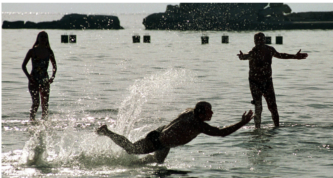
Artikkelforfatteren anbefaler turister å ikke bare nyte Kroatiens strender, men også bruke tid på den lokale kunsten. Bildet er fra en strand utenfor byen Split.

A t det ikke skulle være marked for et slikt galleri i Split, kan man jo undres over. Byen er nord-europeernes nye ferieyndling, og fylles hver sommer nær sagt til randen av turister. Gjестene står i kø for å ta