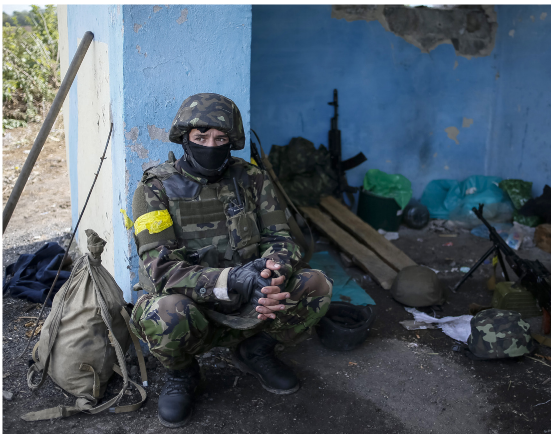
Artikkelforfatteren forteller om pressefrihet under press i dagens Ukraina. Bildet viser et medlem av den ukrainske nasjonalgarden på en kontrollpost i den østlige delen av landet.