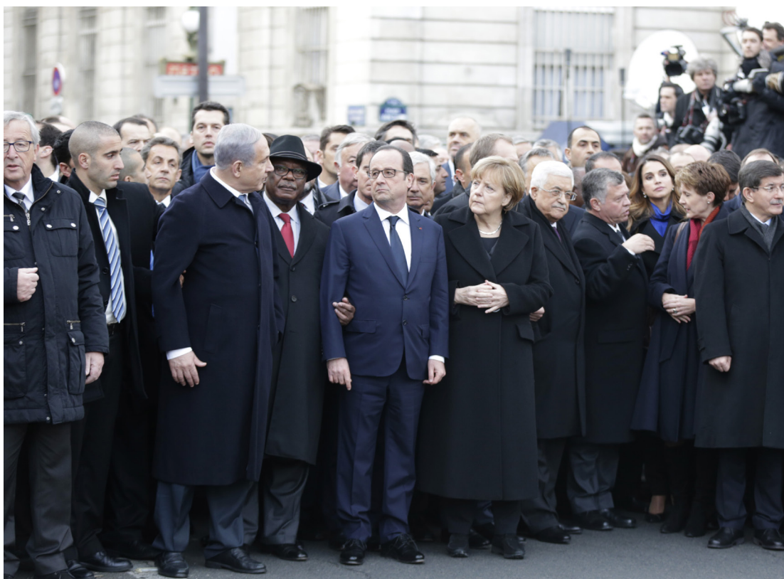
Det som skjedde i Frankrike var først og fremst var brutale mord, og at de som har den største jobben å gjøre for å sikre full rett til fri ytring, de gikk først i toget gjennom Paris' gater. De har sånn sett et stykke igjen å gå, skriver artikkelforfatteren.

Ytringsfrihet er et juridisk anliggende. Loven garanterer, eller unnlater å garantere, ytringsfrihet. Full ytringsfrihet innebærer derfor også frihet til å komme med rasistiske utsagn, til å ytre antimittistiske holdninger, og til blasfemi. Frankrike, som Norge, og en rekke andre vestlige land, har brokete skussmål i så måte. Det er knapt full ytringsfrihet noen steder. I Frankrike forsøkte man også for noen år siden å gjøre fornektelse av folkemord straffbart (med inntil fem års fengsel og en klekkelig bot), men den loven ble stanset på europeisk nivå. Fornektelse av det armenske folkemord er likevel forbudt i land